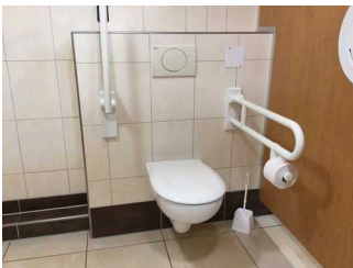
Öffentliche WCs für Menschen mit Behinderung Herren