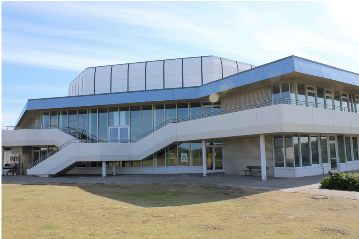
Kulturinsel – Rückansicht