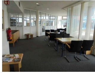
Lesesaal in der Kulturinsel Borkum