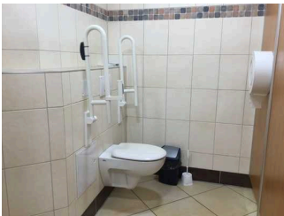
Öffentliche WCs für Menschen mit Behinderung Damen