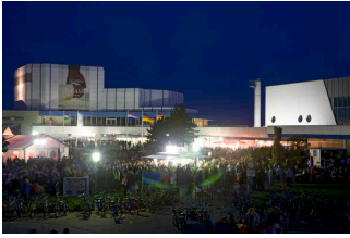
Kulturinsel – Veranstaltung