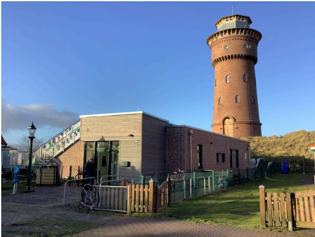
Waterhuus Borkum | ©Joke Pouliart